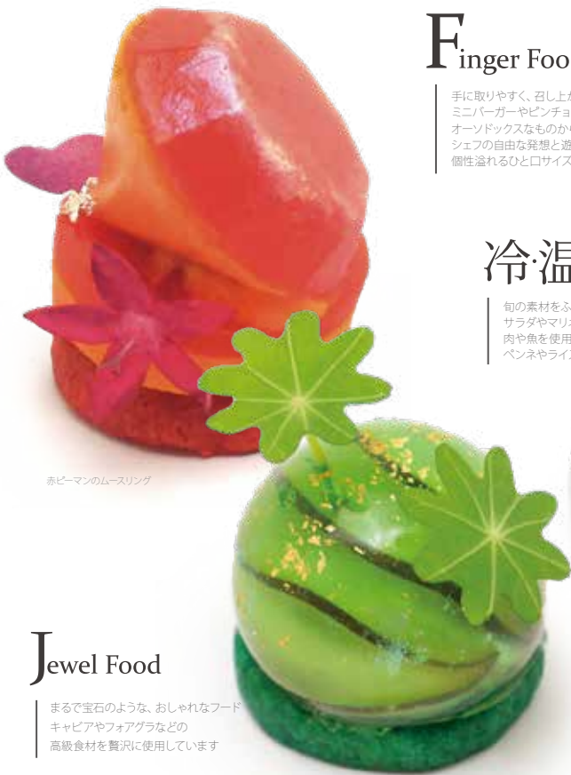
赤ピーマンのムースリング