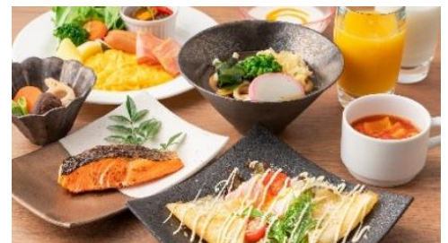
西式自助早餐示意圖