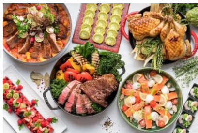
西式自助晚餐示意圖