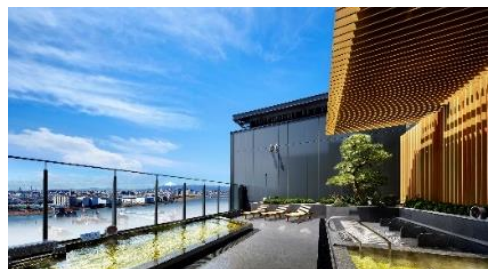
富士見之湯 天氣佳時可看到富士山。