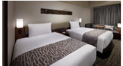
雅緻雙床房示意圖