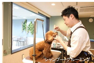
シャンプー・グルーミング