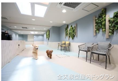
全天候型屋内ドッグラン