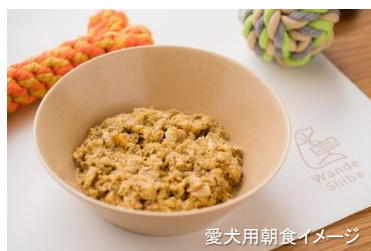
愛犬用朝食イメージ