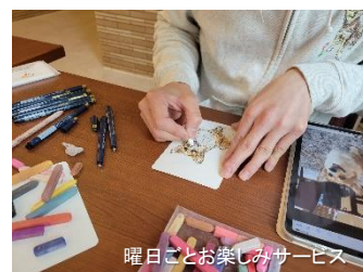
曜日ごとお楽しみサービス