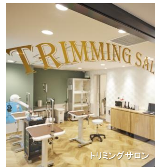
トリミングサロン