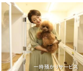
一時預かりサービス