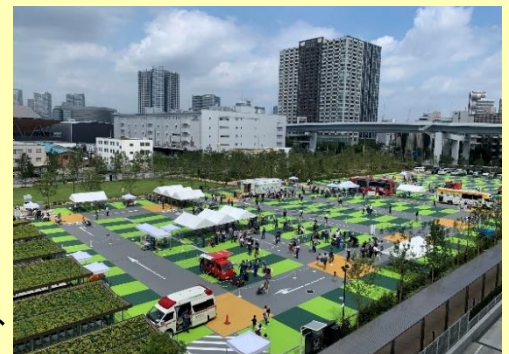
有明ガーデン 屋外でのイベントの様子

住友不動産グループが管理運営する大規模複合施設「有明ガーデン」において、深川消防署とともに、地域の防災力向上を図ることを目的とした親子で楽しく防災知識が学べる啓発イベント「防災・救急フェアin有明ガーデン」を開催いたしました。本イベントでは、有明地域の居住者のほか、街区に訪れた方々にご参加いただき、お子様を含めた多くの皆様に防災への関心を高め、災害に対応できる知識や技術を学んでいただきました。