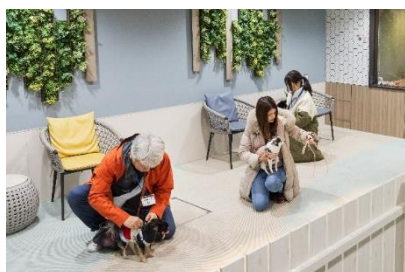
ドッグランでの避難準備の様子