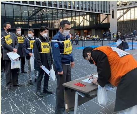
三角広場 一時滞在施設運営実動訓練の様子

新宿住友ビルと同様、港区と受け入れ協定を締結している「住友不動産東京三田ガーデンタワー」において、港区や街区就労者、地元町会と連携し、首都直下地震によりライフラインに甚大な被害が発生し、首都圏交通機能の復旧の見込みが立たず、帰宅困難者受け入れが必要となったことを想定し、一時滞在施設の開設・受け入れプログラムを実施いたしました。当日は、施設の被害状況を把握し、帰宅困難者受け入れが可能であることを港区に連絡の上、受け入れを開始する手順を確認いたしました。さらに、全員が受け入れの際に同意書を記入し、配布物資を受け取るまでの流れを実施することで、発災時にどのような問題が起こり得るかを認識し、有事の際に役立てられることが期待できます。