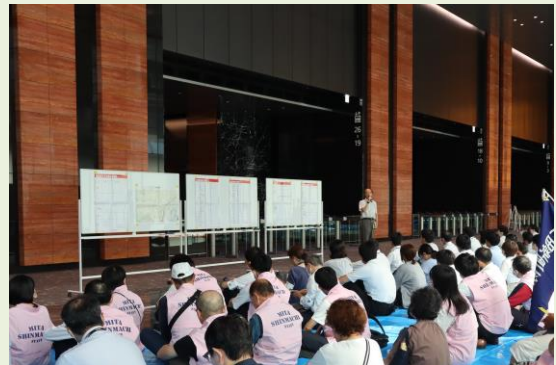
住友不動産東京三田ガーデンタワー 帰宅困難者受け入れ訓練の様子