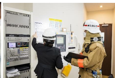
消防隊への引継ぎの様子