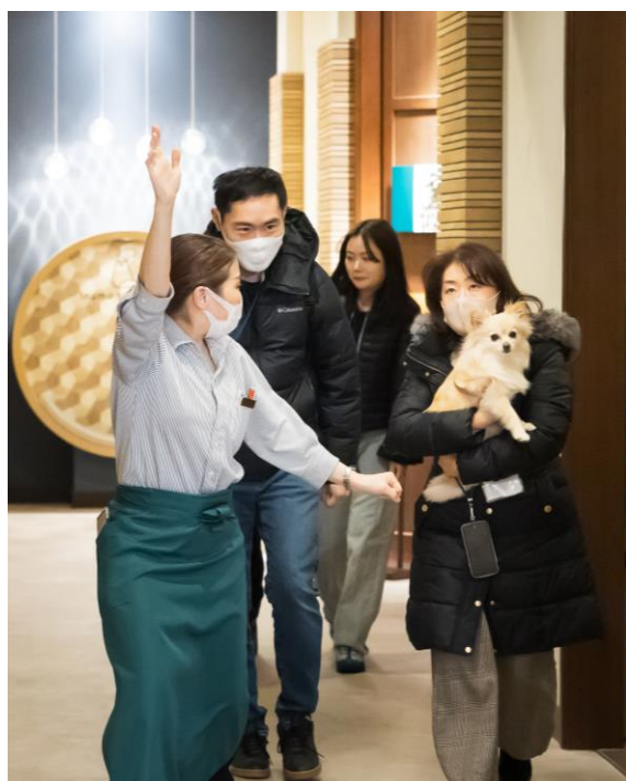
レストランからの避難誘導の様子

当社は、世界各地からお客様が訪れる都心のホテルチェーンとして、快適な滞在空間・サービスのご提供に加え、これからも「安心・安全」なおもてなしに努めて参ります。