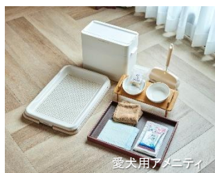
愛犬用アメニティ