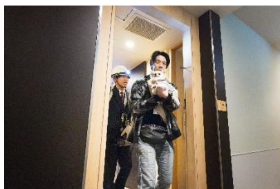
客室から避難する様子