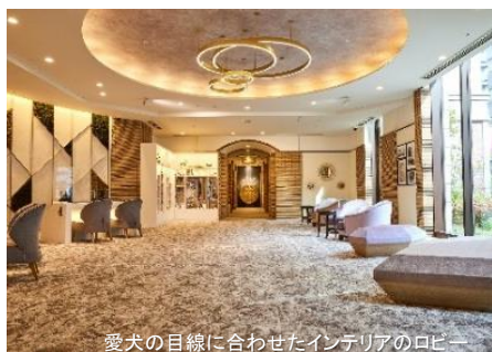
愛犬の目線に合わせたインテリアのロビー