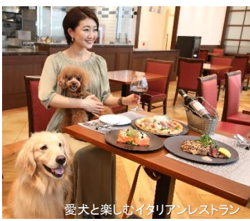
愛犬と楽しむイタリアンレストラン

東京タワーに程近い芝公園エリアに位置するinumo芝公園は、館内どこでも愛犬とリードで歩ける愛犬ファーストなホテルです。屋内ドッグランをはじめトリミングサロン、一時お預かりサービス、愛犬の料理が調理できるキッチンをはじめ、愛犬と入れるイタリアンレストランも併設。平日限定でプロカメラマンによる写真撮影やライブドローイングのイベントも開催しています。