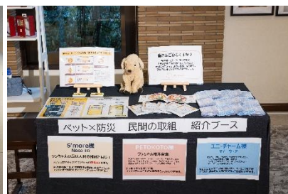
防災備蓄や民間の取組の展示