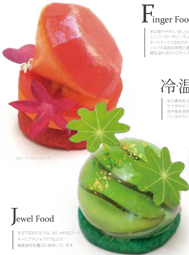
赤ピーマンのムースリング